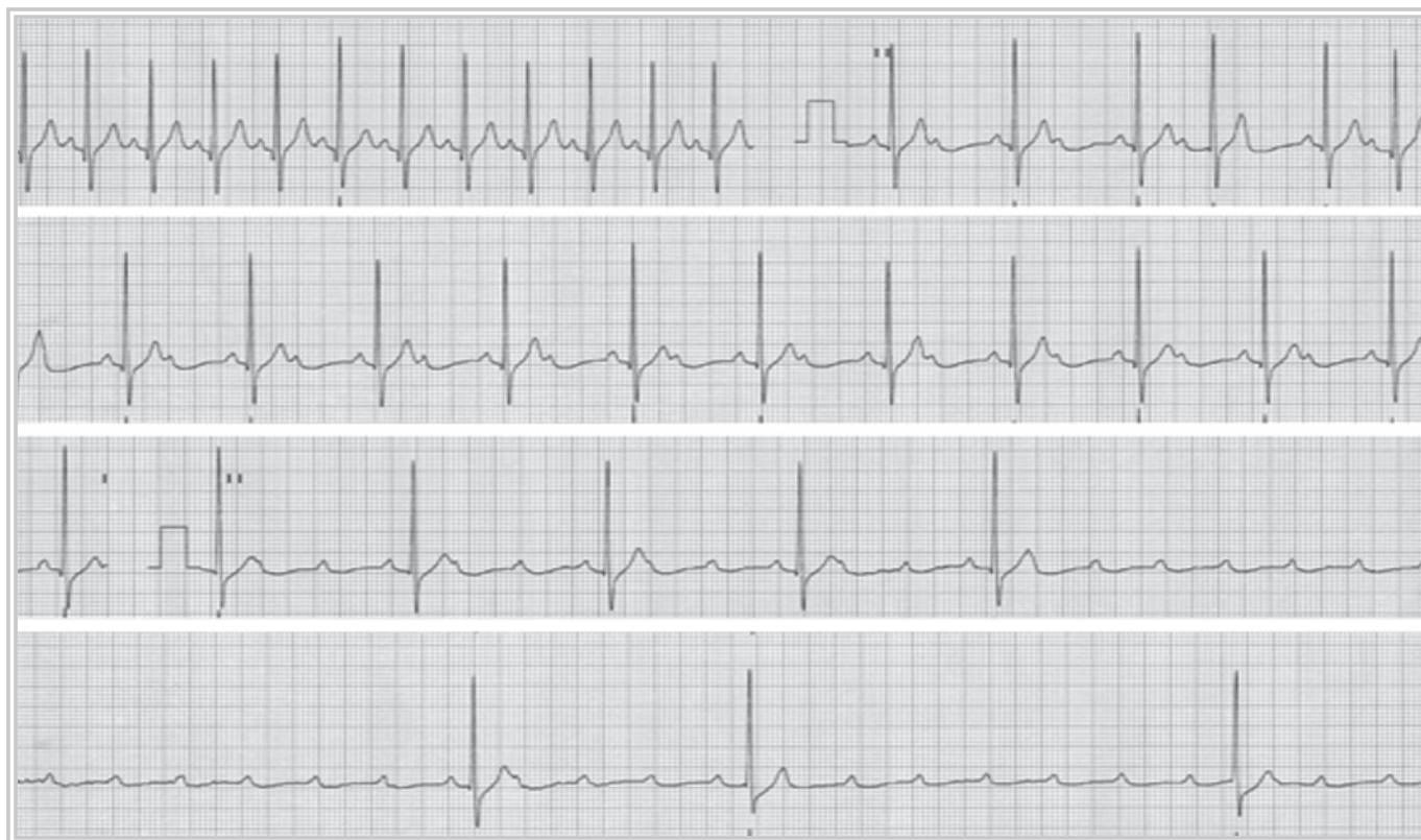
Fig 2. Paciente masculino de 30 años, futbolista, que presentó síntomas y signos compatibles con síncope neurocardiogénico de tipo cardioinhibitorio y bloqueo atrioventricular completo durante la prueba de inclinación, el cual revirtió con la posición de decúbito dorsal (tomado de ref. 3 con autorización).

confundida con taquicardia paroxística supraventricular; el inicio y final no paroxístico alejan esta posibilidad. En esta serie también se encontraron valores elevados de presión arterial durante la prueba (la denominada “hipertensión ortostática”), compatible con la activación adrenérgica inicial con que cursan estos trastornos; además, en varios pacientes jóvenes se observó que el síncope neurocardiogénico coexistió con su debut hipertensivo.