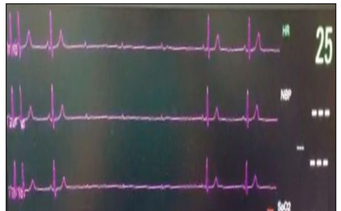
Figura 3. Electrocardiograma que demuestra la parada cardíaca inducida con adenosina