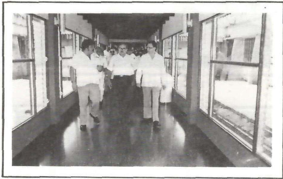
Acuerdo entre las autoridades de la C.C.S.S. y del Seguro Social Panameño, sobre ambos países a los habitantes de la zona limítrofe.