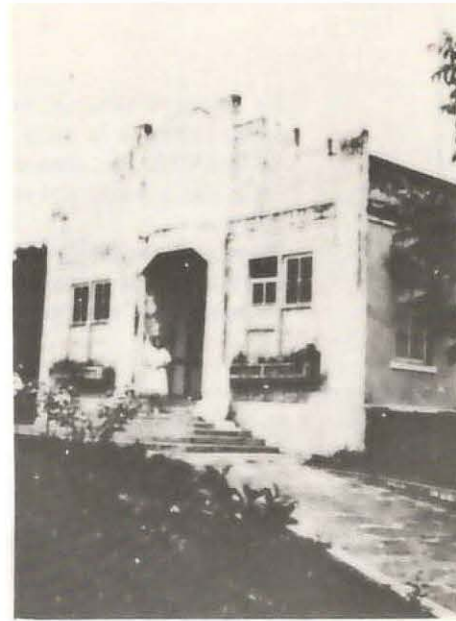
Viejo edificio de la maternidad del hospital de Grecia. Estaba situado al costado este de los terrenos que ocupaba el Hospital. Cuántos griegos vieron la luz en este vetusto edificio.