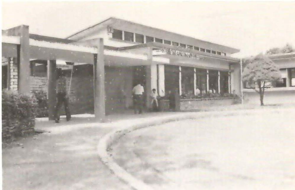
Foto del Hospital "San Francisco de Asís" de Grecia, inaugurado el Domingo 16 de agosto de 1956, el cual celebra sus BODAS DE PLATA este año.

Nuestro centro hospitalario, que en su nuevo edificio y a través de estos veinticinco años ha continuado con la labor que emprendieron, con grandes sacrificios nuestros queridos abuelos.