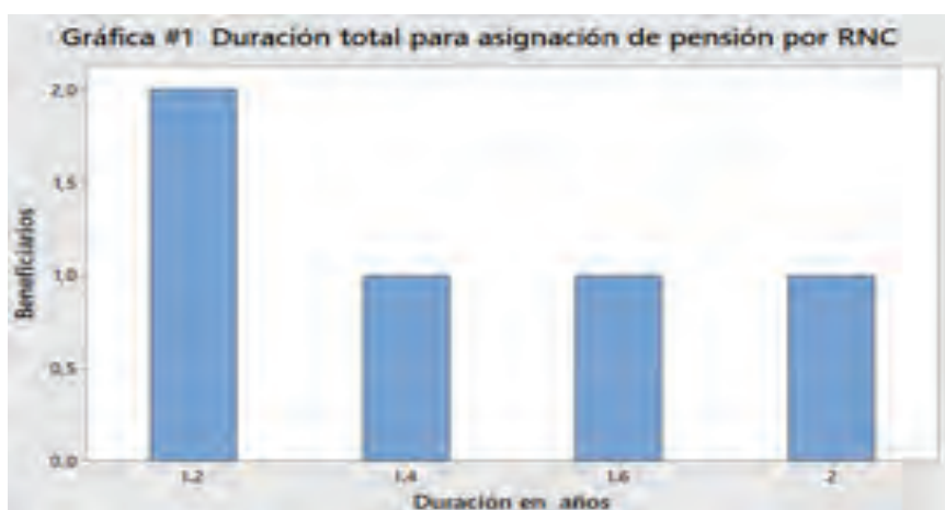
Gráfico 1. Tiempo de asignación promedio para pensión por RNC