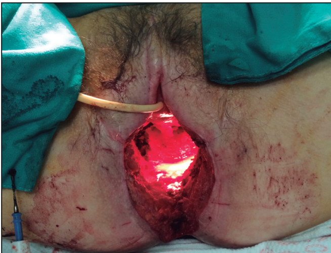
Figura 2. Defecto remanente luego de pélvico-cutáneo tras resección en bloque de tumoración rectal con compromiso de pared posterior de vagina

de alteración en el hábito defecatorio, asociando 3 semanas de evolución de salida de heces por vagina. Al examen físico se evidencia tumoración anterior de unos 5cm de diámetro que compromete ano y pared posterior de vagina (fístula rectovaginal). Se realiza colonoscopia completa que muestra: “carcinoma ano-rectal de 5cm en pared anterior”, cuya biopsia evidencia: “adenocarcinoma probablemente invasor”. El TAC de Cuello-toraco-abdomino-pélvico reporta: “bocio multinodular con proyección intratorácica, tórax sin lesiones, no presencia líquido libre, hígado, bazo, páncreas, riñones y suprarrenales sin lesiones, engrosamiento ano-rectal en una longitud de 78mm, con múltiples adenopatías perilesionales”. Se realiza una resonancia magnética que reporta: “masa infiltrante mamelonada que afecta el tercio inferior del recto y que impresiona afectar el esfínter del ano, con múltiples adenopatías, lesión parece contactar con la pared postero-inferior de la vagina, existiendo imagen sugestiva de un trayecto fistuloso en el aspecto posterior derecho entre la vagina inferior y el recto distal”. Se lleva a quirófano donde se realiza colostomía en asa de colon sigmoides. Luego de esto completa terapia neoadyuvante con radioterapia y quimioterapia. De seguido, la paciente es llevada nuevamente a quirófano, donde se evidencia tumoración exofítica que compromete