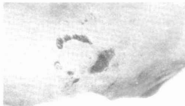
Fig. 2. Localización y orientación de las marcas de dientes.