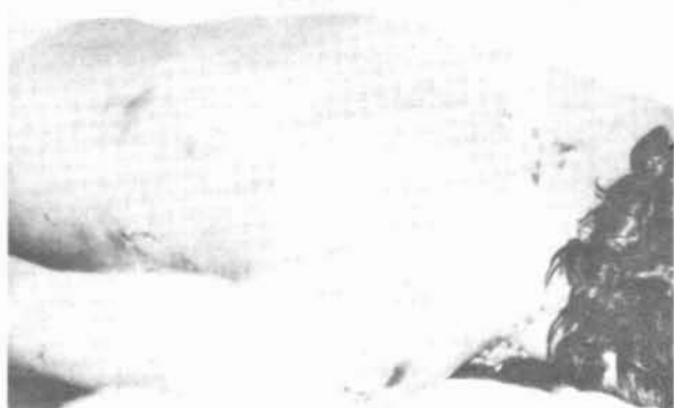
Fig. 1. Mordedura en el hombro derecho de la víctima.

Del estudio comparativo se dedujo que las marcas en el hombro derecho de la víctima (fig. 4), no podrían haber sido producidas por otra persona que no fuera el imputado. Coincidió el tamaño de las arcadas, el ancho de cada diente, y la dis-