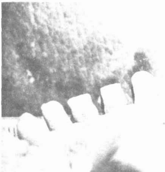
Fig. 5. Comparativo de marcas en la víctima y modelo de los dientes del imputado.