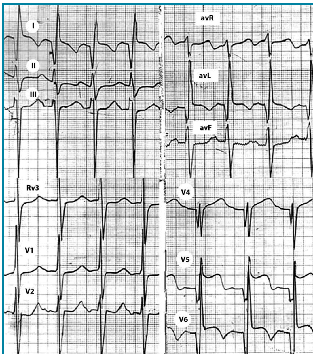
Figura 2. Electrocardiograma del paciente antes de ser intervenido quirúrgicamente. Se observan ondas Q largas y profundas las derivaciones D1 y aVL, y en V4-V6, que dan aspecto de infarto anterolateral.

Existen signos típicos de infarto anterolateral; las ondas Q largas y profundas aparecen típicamente en las derivaciones D1 y aVL, y en V4-V6 4,12,24,25 y raramente aparecen en las derivaciones precordiales derechas. Es frecuente encontrar signos de hipertrofia ventricular izquierda con desviación del eje hacia la izquierda 4,22,26 . El mecanismo de la desviación del eje hacia la izquierda es desconocido, pero puede relacionarse en parte a el grosor desproporcionado de la pared posterobasal 16,19 .