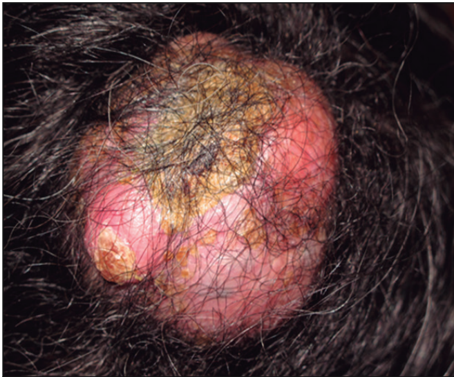
Figura 1. Tumor triquilemal proliferante en cuero cabelludo.

Hallazgo clínico: neoformación, exofítica, lobulada, de 10 cm x 7 cm, con costras amarillentas, de superficie lisa, color rosado, con telangiectasias, localizada en zona parieto-occipital derecha