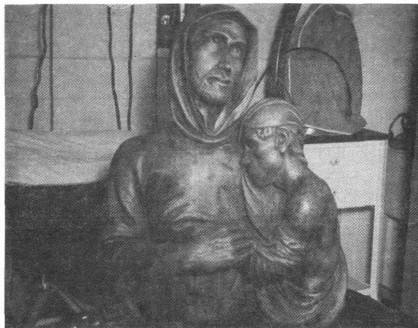
ESCULTURA DE "SAN JUAN DE DIOS"