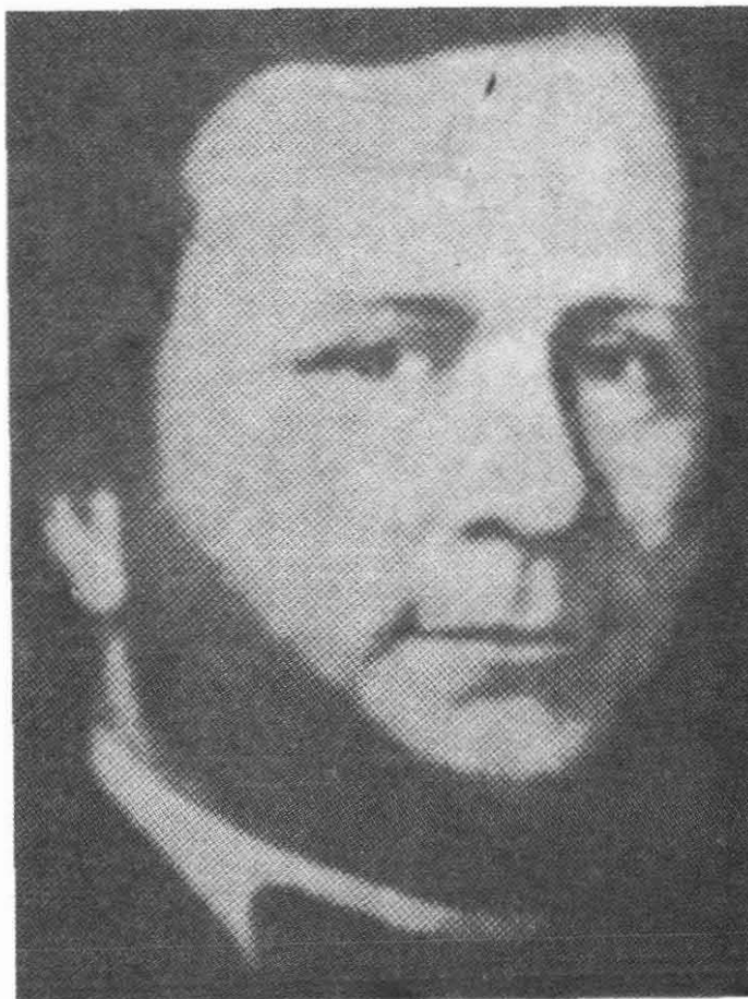
DR. JOSE MARIA CASTRO MADRIZ EX-PRESIDENTE DE COSTA RICA Y GESTOR DEL HOSPITAL