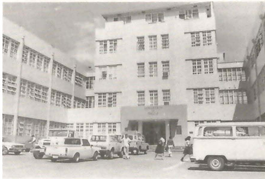
Integración de servicios médicos: Ministerio de Salud – Caja Costarricense de Seguro Social. 1975.