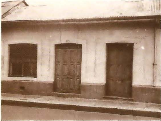
1. La Caja Costarricense de Seguro Social inició sus labores en un pequeño local ubicado en Avenida 3, calles 3 y 5, frente a Uribe y Pagés, donde hoy día se encuentra Pollos Pío-Pío.