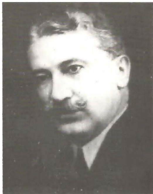
Primer Gerente de la Caja Costarricense de Seguro Social, don Julio Acosta García.