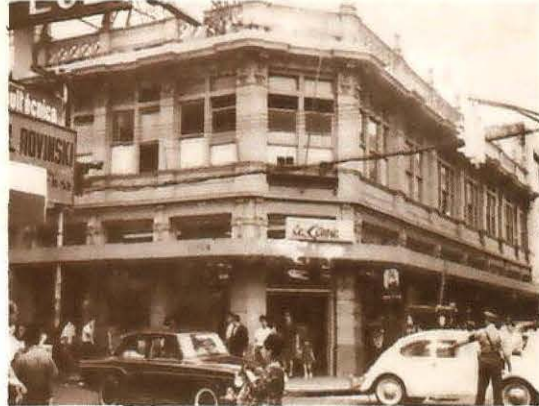
2. La segunda sede de la institución es actualmente el Almacén Rilasa en Avenida 3, calles 2 y 4.