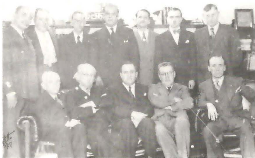
Primera Junta Directiva de la C.C.S.S.