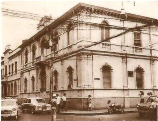
3. El actual edificio del Banco Nacional, Avenida Central, calle 0 fue la antepenúltima sede de la Caja.