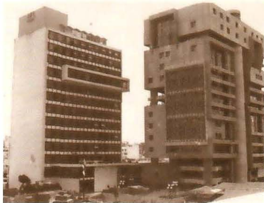
4. En la actualidad las oficinas centrales ocupan dos edificios ubicados en Avenida 2da., calles 5 y 7.