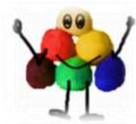
Ser como Flexi

Dígale al niño o niña que escriba o dibuje una situación cuando perdió y otra cuando ganó. Cuando tenga los dibujos listos conversen de que a pesar de que vivió ambas cosas “sigue siendo él o ella misma y no le pasó nada”. Enfatice que lo importante es participar y compartir.