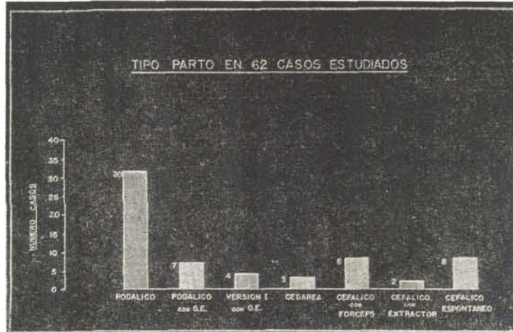
CUADRO No. 2